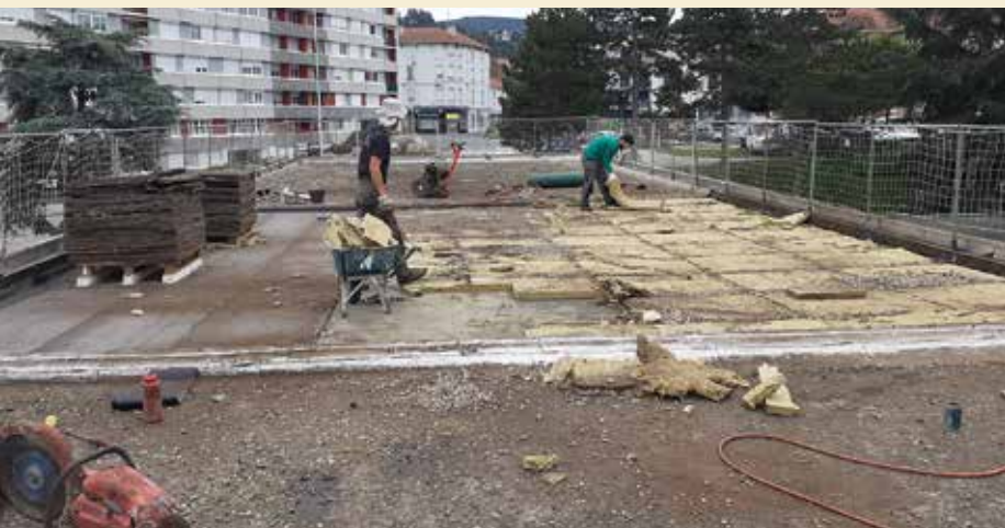
Toit de la Tardive cet été