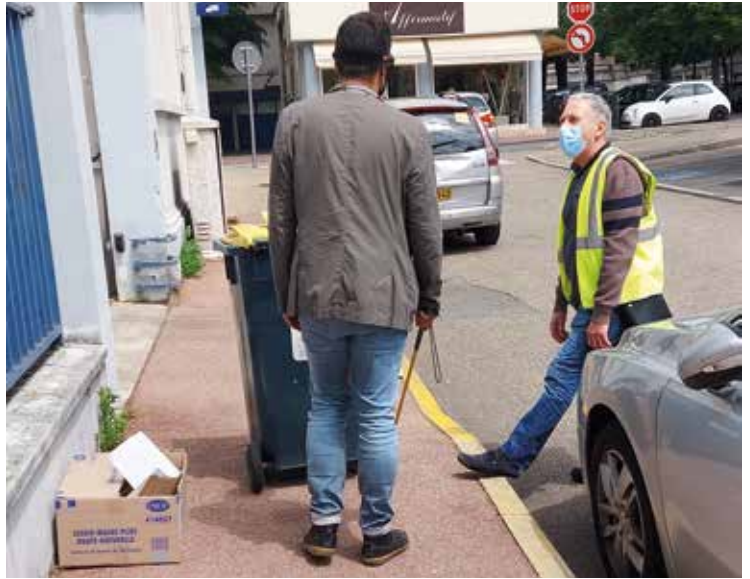
Tremplin vers l'emploi / Formation BNSSA