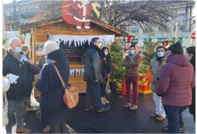
Opération chèques cadeaux