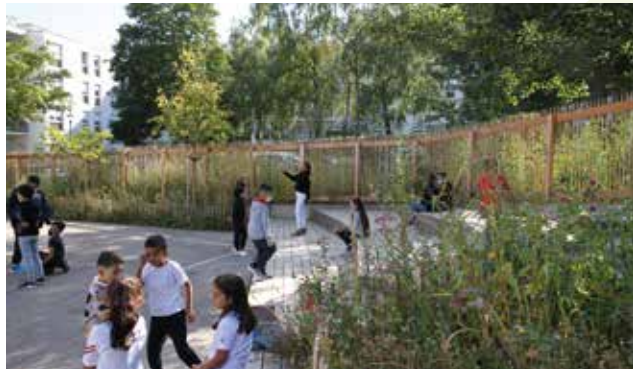
Végétalisation de la cour de l'école Waldeck Rousseau (cour Oasis)