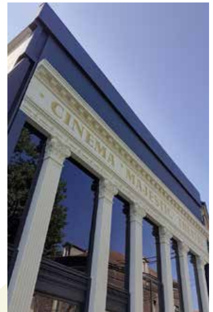
Le Majestic rénové