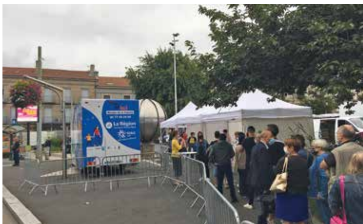
Opération de vaccination mobile