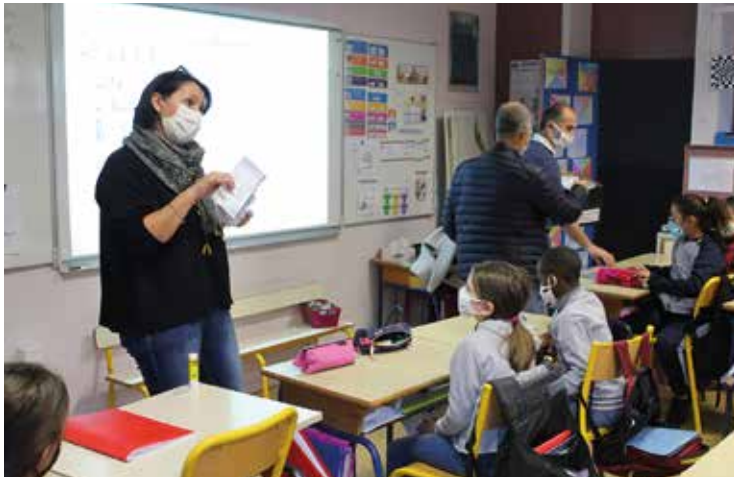
Distribution de masques dans les écoles