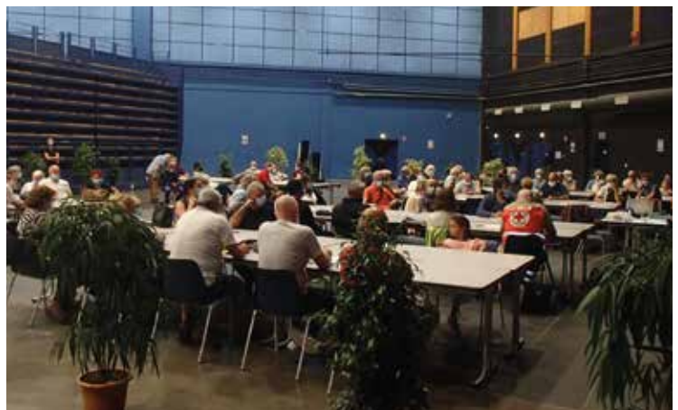
Assemblée générale des Sixquarts