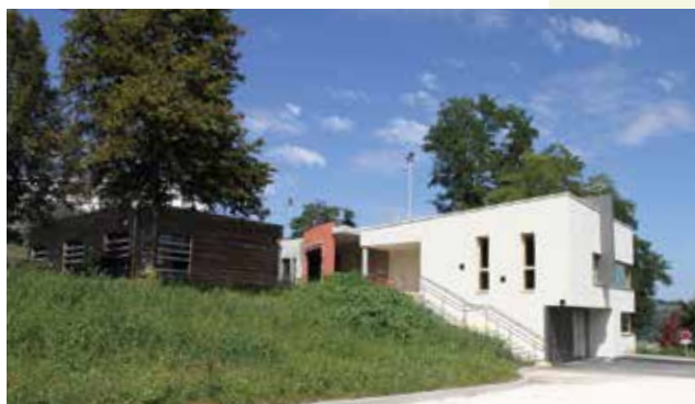
Extension du centre social du Soleil Levant