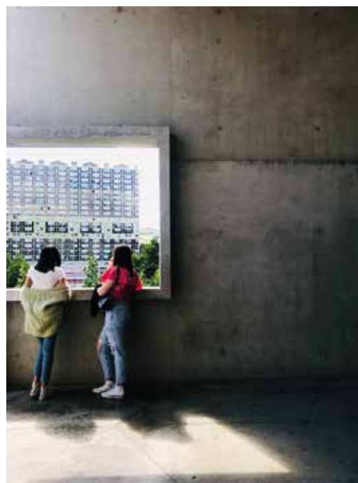
© Centre d'animation de Firminy-Vert + Chic, de l'Archi ! - Détail église Saint-Pierre, Site Le Corbusier - FLC-ADAGP-

L'association Chic, de l'Archi ! est intervenue auprès du secteur jeunes du centre d'animation de Firminy-Vert. Ils sont d'abord partis à la découverte du quartier et de ses principaux édifices, avec les médiatrices du Site Le Corbusier. Ils ont ensuite laissé libre cours à leur imagination en mettant en scène ce quartier à travers des photos, éditées en cartes postales qu'ils ont utilisées pour collecter des témoignages d'habitants. Enfin, ils ont analysé les espaces qu'ils fréquentent au sein du quartier. À partir de toutes ces données, l'association Chic, de l'Archi ! a proposé un travail sensible basé sur la cartographie des espaces réels et perçus, les endroits remarquables ou non, qui sont les lieux de vie de tous les participants.