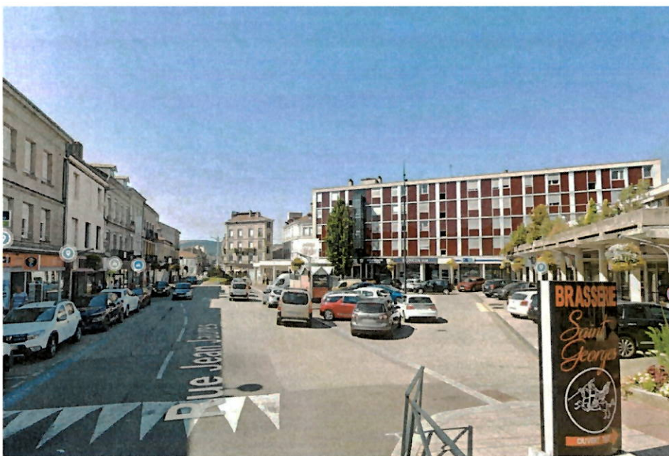
Rue Jean Jaurès - avant