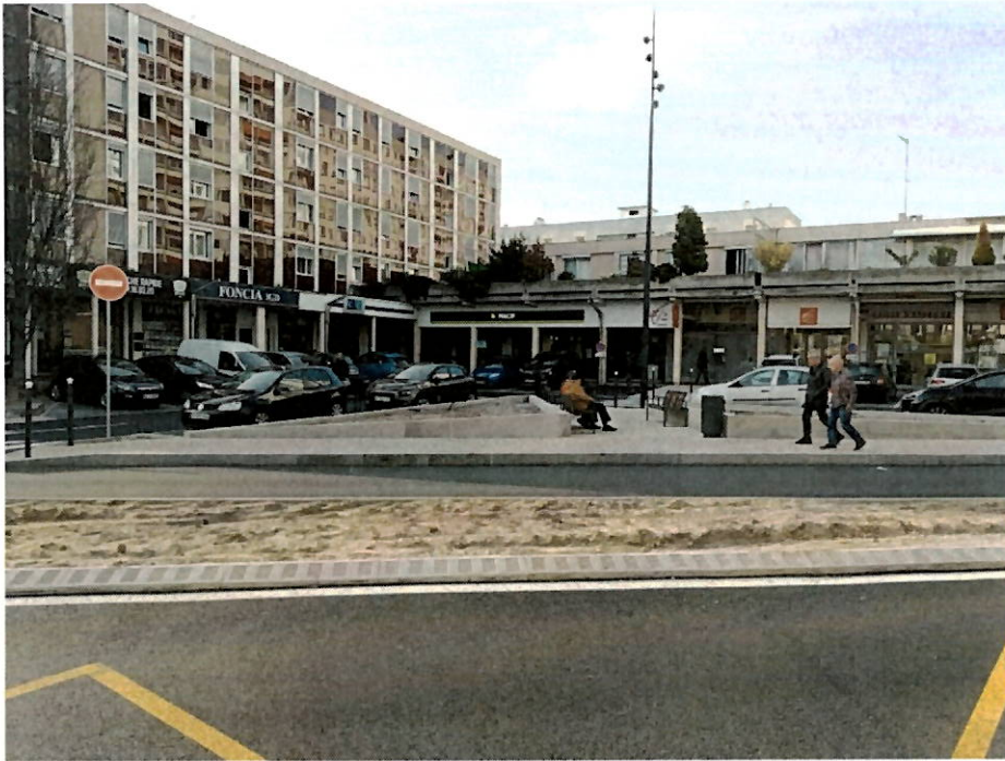
Rue Jean Jaurès - après