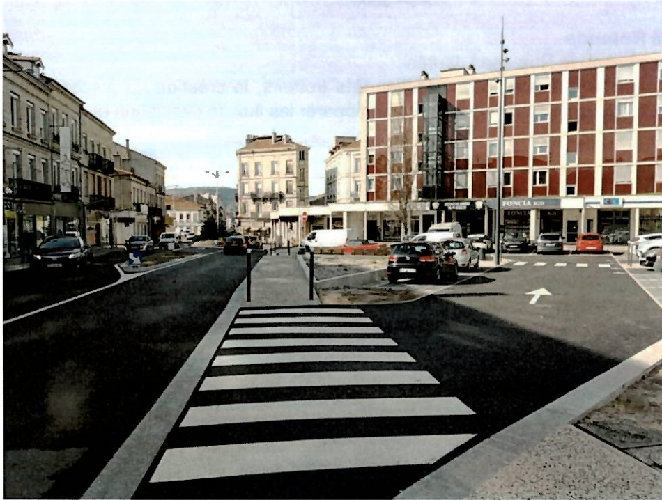
Rue Jean Jaurès - après