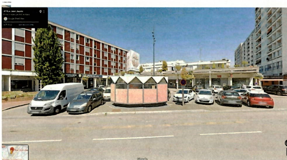
Rue Jean Jaurès - avant