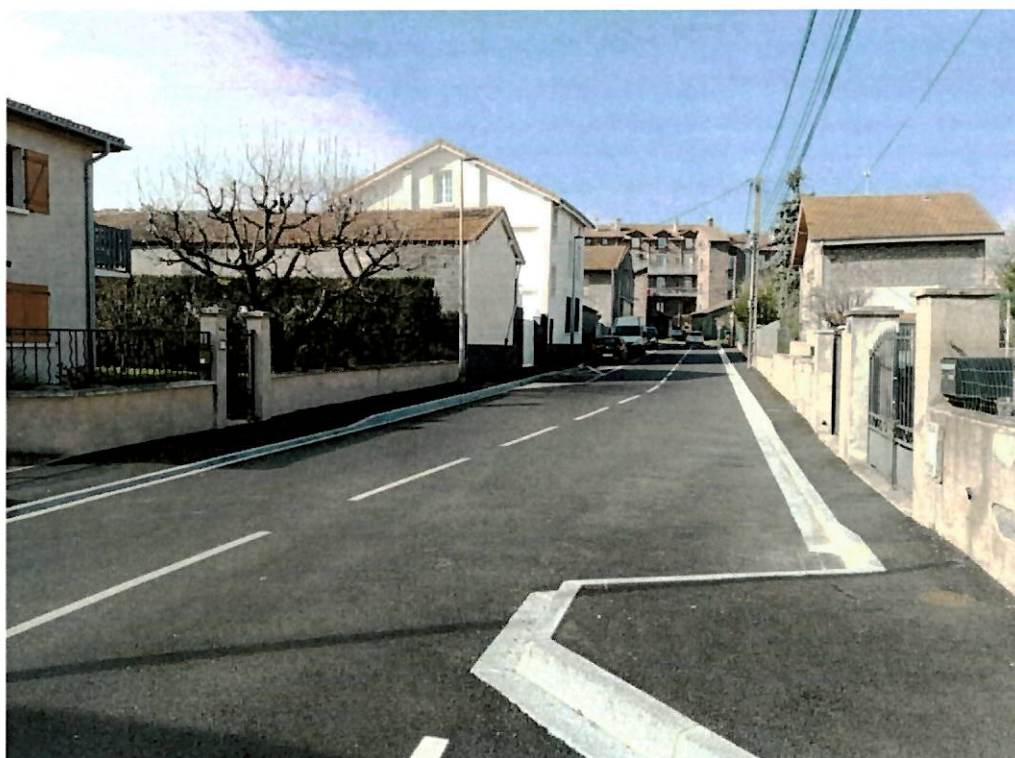
rue Felix Pepier - Après